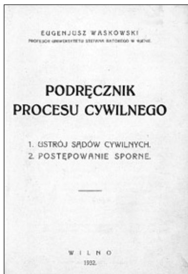
Strona tytułowa Podręcznika procesu cywilnego (Wilno 1932)