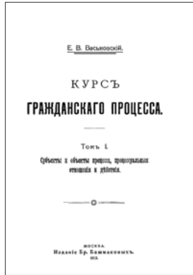
Strona tytułowa podręcznika Курсъ гражданскаго процесса (Moskwa 1913)